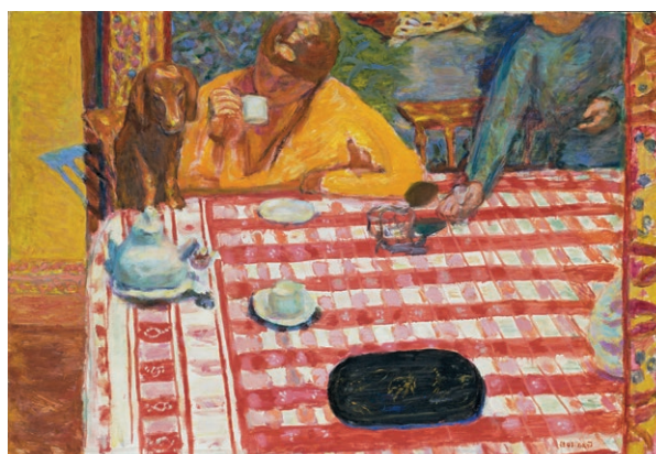
Pierre Bonnard, Le Café , 1915 Tate, Londres Presented by Sir Michael Sadler through the Art Fund 1941