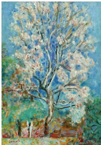
Pierre Bonnard, L'Amandier en fleurs , vers 1930 Musée Bonnard, Le Cannet