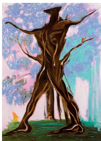
Roberto Mangú Quesada, Grand vivant , 2019 Collection particulière

Identifiant : medialmb Mot de passe : medialmb