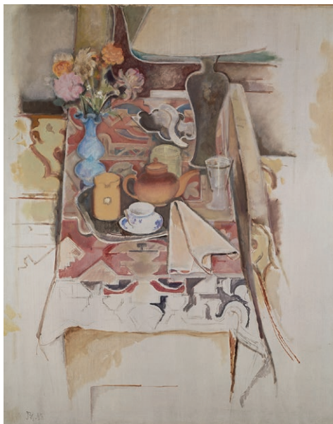
Balthus, Nature morte à la lampe , 1958 Marseille, musée Cantini - Photo © RMN-Grand Palais / Christian Jean © Madame Klossowska de Rola © Adagp, Paris 2021