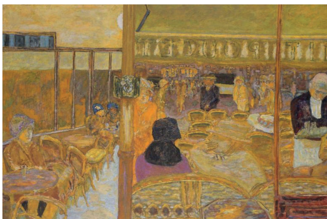
Pierre Bonnard, Le Café du Petit Poucet , 1928 Besançon, musée des Beaux-Arts et d'Archéologie, dépôt du MNAM

Identifiant : medialmb Mot de passe : medialmb